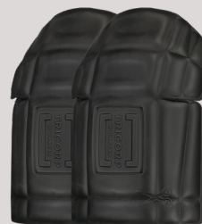
KNIEKUSSENS ■ 652002