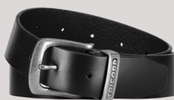
RIEM LEER ■ 652007