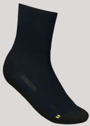
WERKSOK 2-PACK 70 GRAM ■ 602008