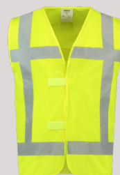
VEILIGHEIDSVEST RWS ■ 453015