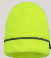
MUTS REFLECTIE ■ 653003