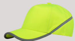
CAP REFLECTIE ■ 653002